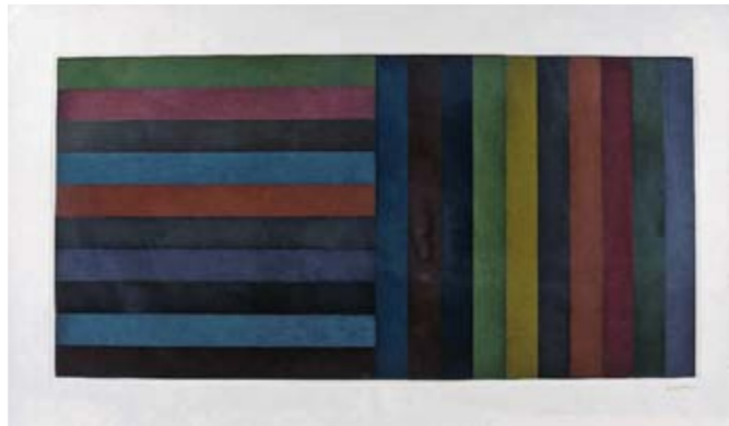
Sol Lewitt , Horizontal color bands and vertical color bands , 1990 Série de 7 pièces, gravures sur papier, 61 x 195 cm chacune