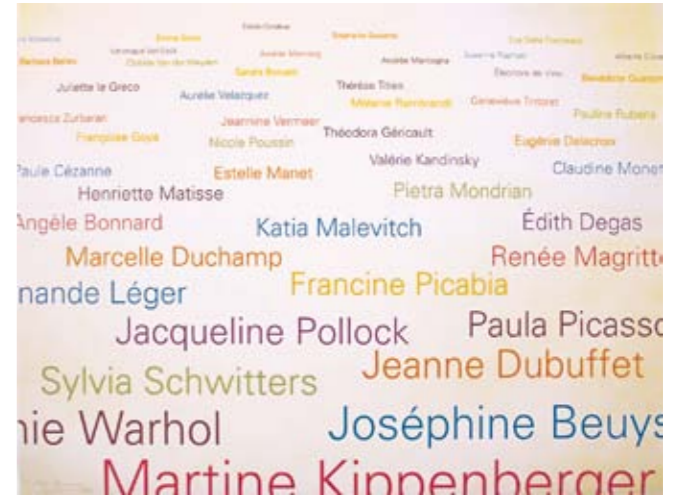
Agnès Thurnauer , XX Story , 2005 Sérigraphie, 120 x 160 cm