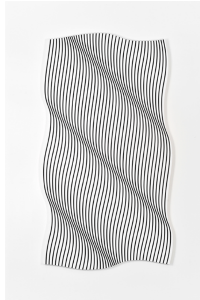
Philippe Decrauzat , Untitled , 2011 Acrylique sur toile, 200 x 119 cm