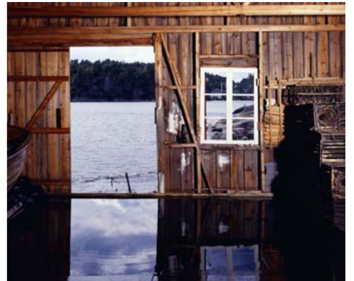
Per Barclay , Norvège , 1990 Photographie, 125 x 150 cm