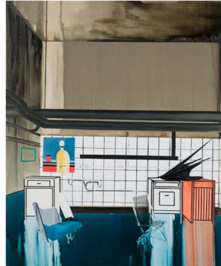
Farah Atassi, Transitional Home , 2009 Huile sur toile, 195 x 160 cm