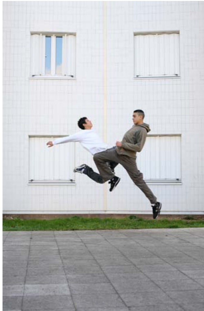
Denis Darzac, La Chute 08 , 2006 Tirage argentique sur aluminium, 108,5 x 73,5 cm

— BRUNO BARBEY / OLAF BREUNING / DENI DARZACQ / GILBERT GARCIN / JONATHAN MONK / JI YEON SUNG