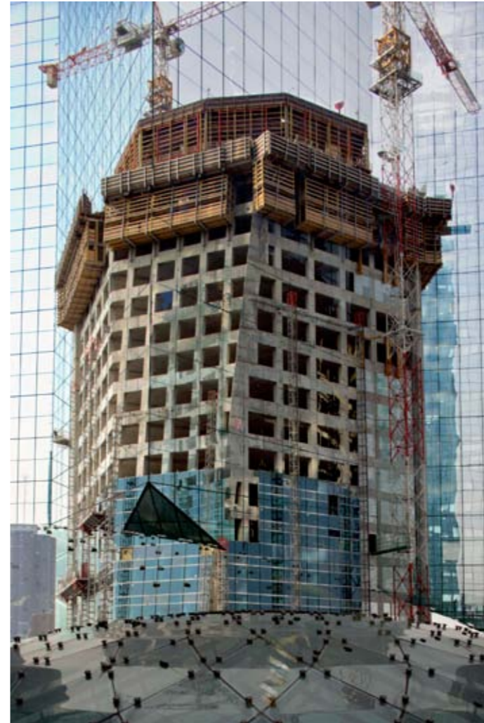
Stéphane Couturier , Tour granite, La Défense , 2008 C-print Diasec, 110 x 90 cm env.