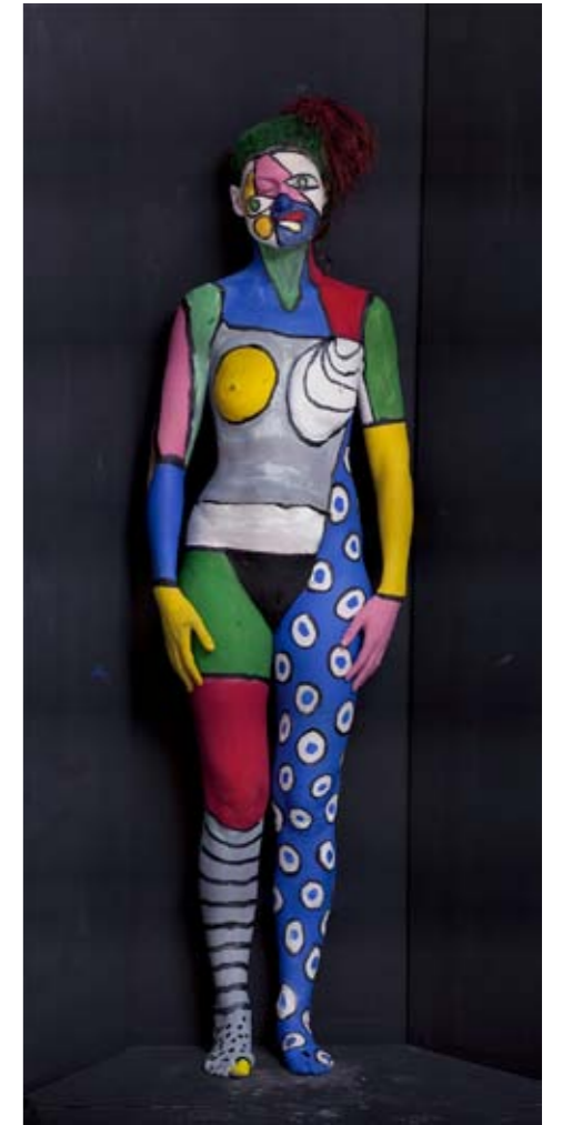
Olaf Breuning, Pablo , 2011 C-Print 190 x 87,6 cm