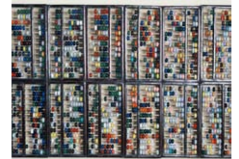
Liu Bolin , Hide in the City - Paris - 03 , 2011 Photographie, 118 x 150 cm, 95 x 120 cm, 63 x 80 cm Performance réalisée dans la Salle des coffres de l'Agence Centrale Société Générale en 2011