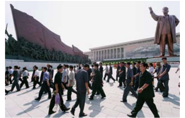
Eric Rondepierre , Sortie , 2008 Tirage lfochrome, 50 x 67 cm