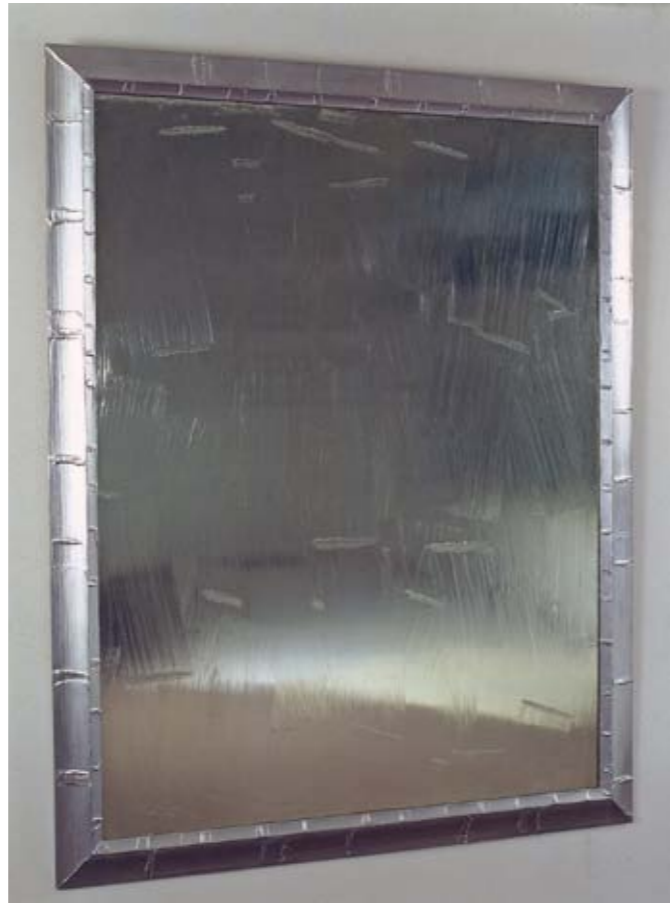
Bertrand Lavier , Cléanthis , 2002 Peinture acrylique sur miroir 185 x 150 cm

— ELODIE ET DELPHINE CHEVALME / STÉPHANE COUTURIER / BERTRAND LAVIER / ALEX PLADEMUNT / ERIC POITEVIN / ANTOINE SCHNECK / AGNÈS THURNAUER