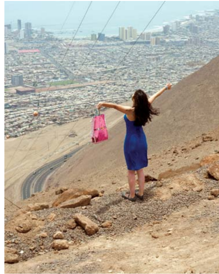
Jordi Colomer , Le sac rose , 2008 Tirage lightjet sur papier argentique, 140 x 115 cm