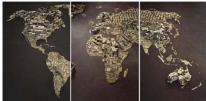
Marjan Teeuwen , Archief 3 , 2007 Photographie, 110 x 117 cm