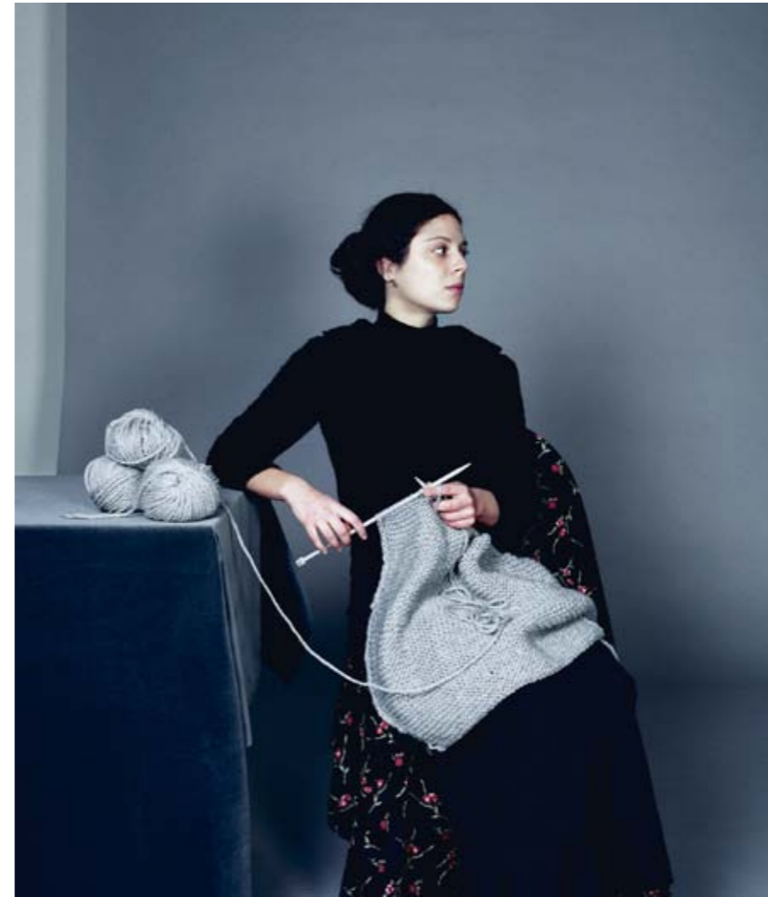
Ji Yeon Sung, La tricoteuse , 2006 Tirage Lambda contrecollé sur aluminium, 108 x 94 cm