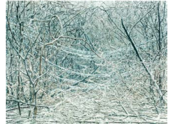
Sonja Braas, The Quiet of Dissolution - Ice Storm , 2005 C-print diasec, 160 x 200 cm