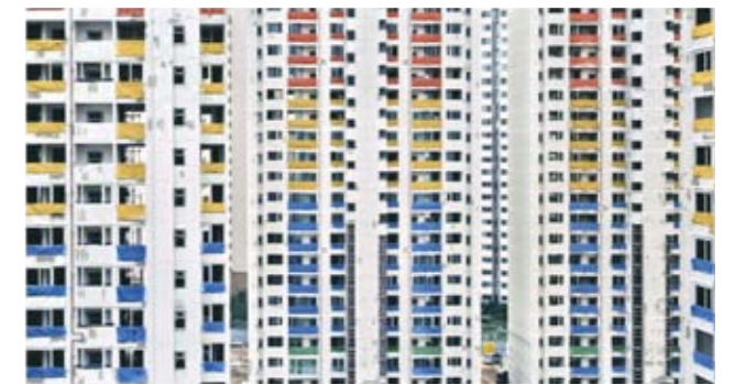
Stéphane Couturier, Séoul , 2002 C-print Diasec, 123 x 235 cm