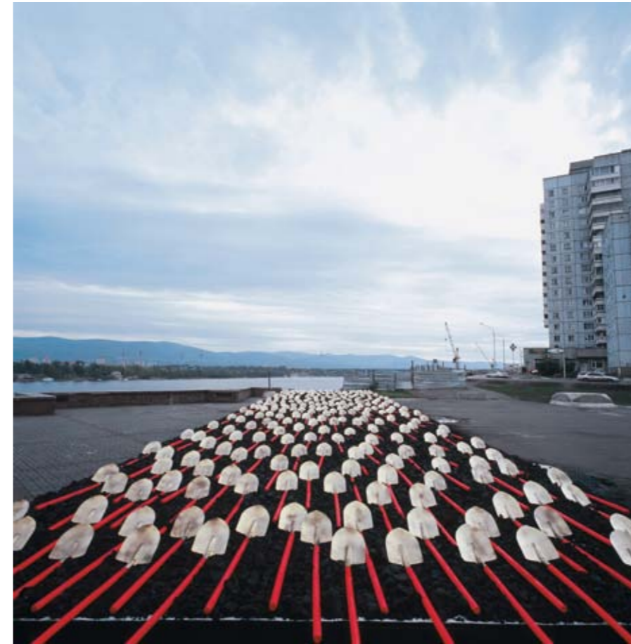
Matej Andreaz Vogrincic , Untitled (Shovels) , 2005 Photographie, 200 x 150 cm